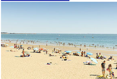
La Baule Plage Remblai