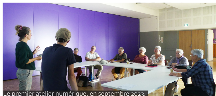
Le premier atelier numérique, en septembre 2023.

Le CLIC accompagne également les personnes en situation de handicap, en lien avec la Maison départementale des personnes handicapées de Loire-Atlantique (MDPH), dans des missions d'information, d'évaluation, d'aide à la constitution du dossier MDPH et de suivi.