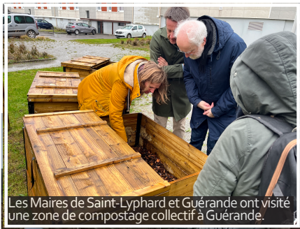
Les Maires de Saint-Lyphard et Guérande ont visité une zone de compostage collectif à Guérande.

Ces informations sont susceptibles de varier en fonction des conditions de la course.