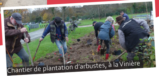
Chantier de plantation d'arbustes, à la Vinière