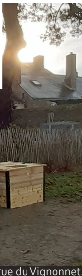
Une zone similaire sera installée rue du Vignonnnet.

i Direction Prévention et Gestion des Déchets de CapAtlantique La Baule-Guérande Agglo : accueil.herbignac@cap-atlantique.fr 02 51 76 96 16