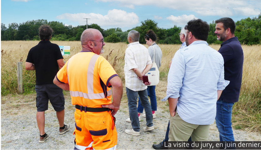
La visite du jury, en juin dernier.