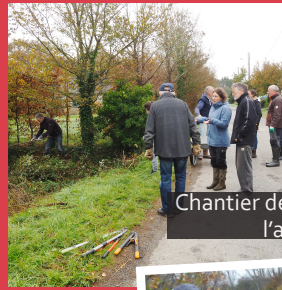
Chantier de curage de la mare de Kerampion, à l'automne dernier, en lien avec le CPIE