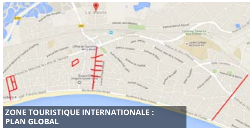
ZONE TOURISTIQUE INTERNATIONALE : PLAN GLOBAL

Et bien sûr, il faut continuer de se laver très fréquemment les mains avec du savon ou une solution hydroalcoolique.