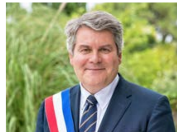
FRANCK LOUVRIER MAIRE DE LA BAULE-ESCOUBLAC CONSEILLER RÉGIONAL DES PAYS DE LA LOIRE