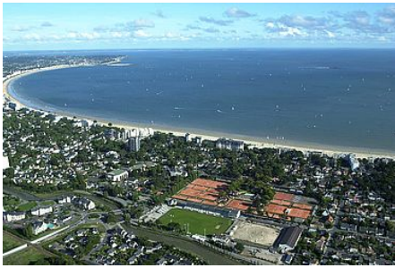
Météo La Baule- Escoublac