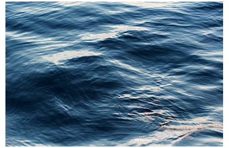
Horaires des marées

Horaires des marées Le Pouliguen - La Baule Escoublac