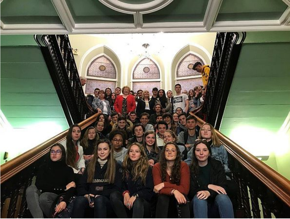
Séjour des élèves du lycée Grand-Air

Inverness est le centre administratif du council area du Highland, et était auparavant la capitale du comté de Inverness-shire et de l'ancienne région du Highland (ainsi que du district d'Inverness au sein de cette région). Elle est, de manière plus générale, la plus grande ville et le pôle d'attraction de toute la région des Highlands. La ville, qui a le statut de cité, s'est autoproclamée capitale des Highlands.