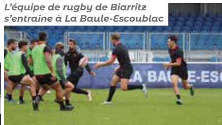
L'équipe de rugby de Biarritz s'entraîne à La Baule-Escoublac