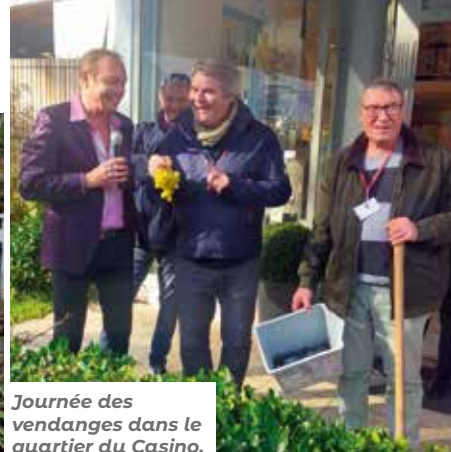
Journée des vendanges dans le quartier du Casino.