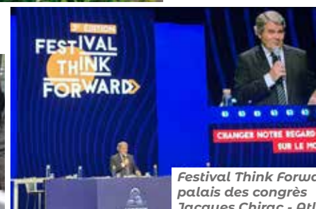
Festival Think Forward au palais des congrès Jacques Chirac - Atlantia