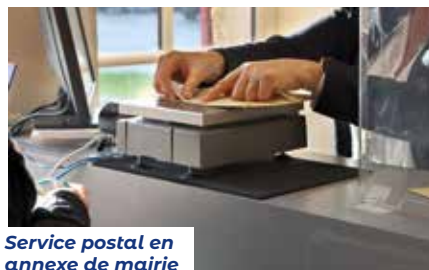
Service postal en annexe de mairie