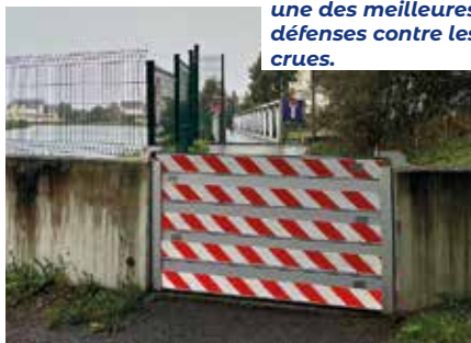
Les batardeaux, une des meilleures défenses contre les crues.

On notera en particulier que les surélévations et les batardeaux installés le long de l'étier entre La Baule et Le Pouliguen ont été très efficaces. ■