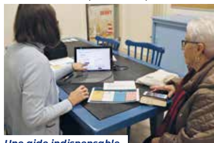
Une aide indispensable pour les démarches numériques

La fréquentation de ce service montre qu'il est une réponse concrète à un véritable besoin: en 2021, ce sont 162 usagers qui l'ont utilisé pour près de 580 cette année. (+ 358 % !)