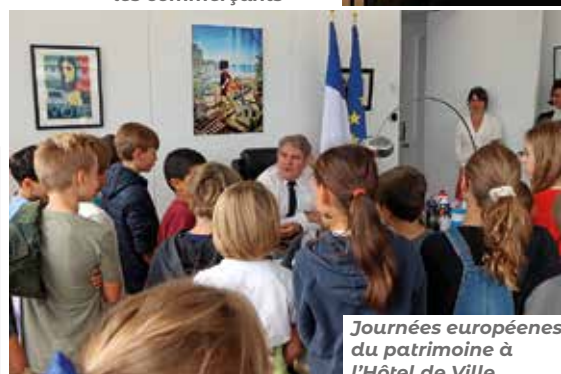
Journées européennes du patrimoine à l'Hôtel de Ville