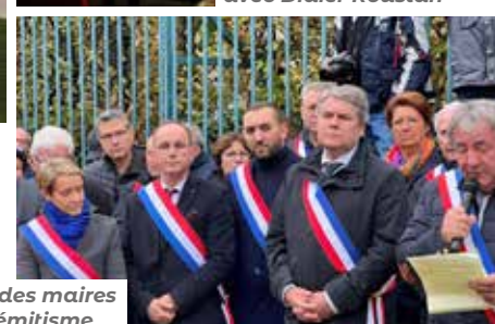
Mobilisation des maires contre l'antisémitisme

*L'abus d'alcool est dangereux pour la santé. À consommer avec modération.