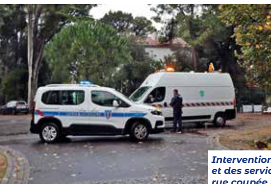
Intervention de la Police municipale et des services techniques pour une rue coupée par la chute d'un arbre.