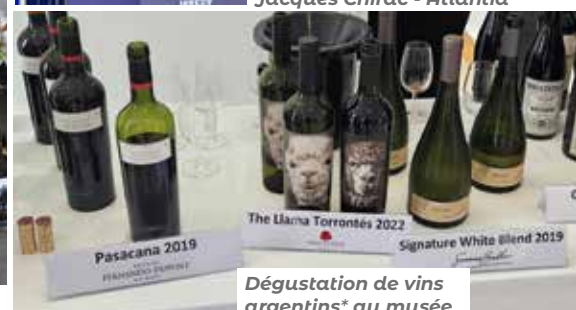
Dégustation de vins argentins* au musée Boesch, organisée par l'Ambassade d'Argentine en France.