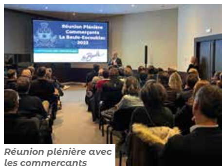
Réunion plénière avec les commerçants