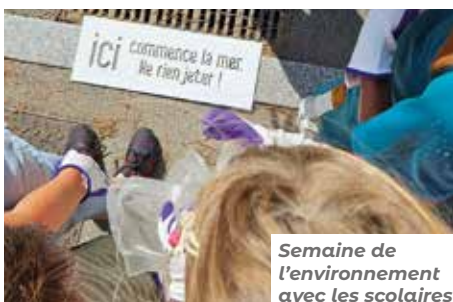
Semaine de l'environnement avec les scolaires