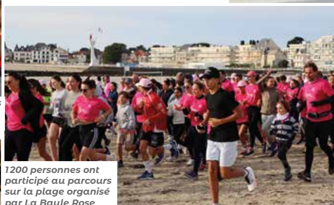
1200 personnes ont participé au parcours sur la plage organisé par La Baule Rose