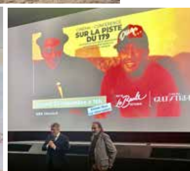
Cinéma conférence avec Didier Roustan