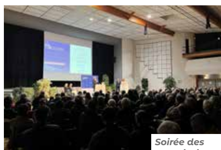
Soirée des associations