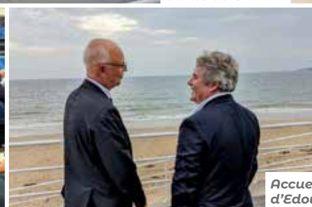
Accueil d'Edouard Philippe