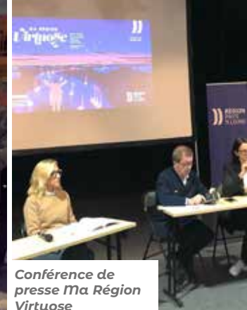
Conférence de presse Ma Région Virtuose