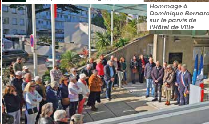
Hommage à Dominique Bernard sur le parvis de l'Hôtel de Ville