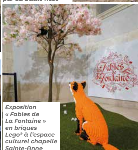
Exposition « Fables de La Fontaine » en briques Lego® à l'espace culturel chapelle Sainte-Anne