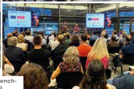
Conférence French-Tech / Le Labb