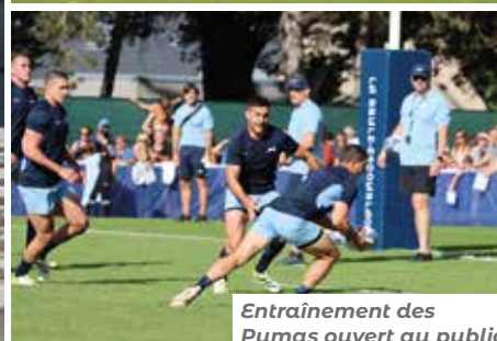
Entraînement des Pumas ouvert au public