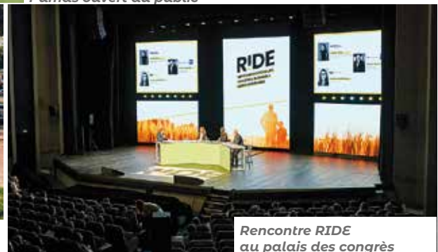
Rencontre RIDE au palais des congrès Jacques Chirac - Atlantia