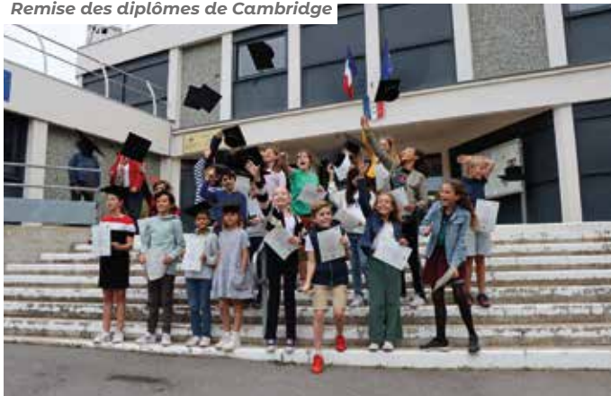
Remise des diplômes de Cambridge