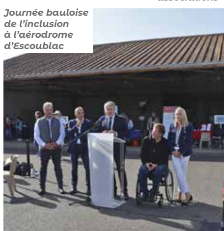
Journée bauloise de l'inclusion à l'aérodrome d'Escoublac