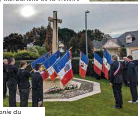
Cérémonie du 11 novembre au cimetière britannique