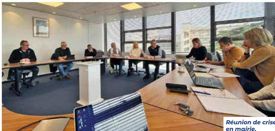
Réunion de crise en mairie.

Le début du mois de novembre a été marqué par une série de très fortes tempêtes, proches de l'ampleur de Xynthia.