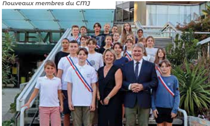
Nouveaux membres du CMJ