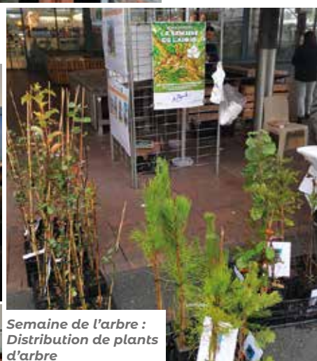
Semaine de l'arbre : Distribution de plants d'arbre