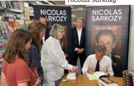
Dédicace du livre de Nicolas Sarkozy