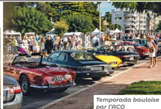
Temporada bauloise par l'ACO