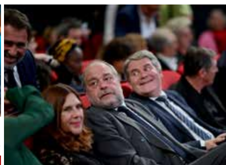
1 er Festival du film et du documentaire politique en présence de M. Dupond-Moretti, Garde des Sceaux, Ministre de la Justice