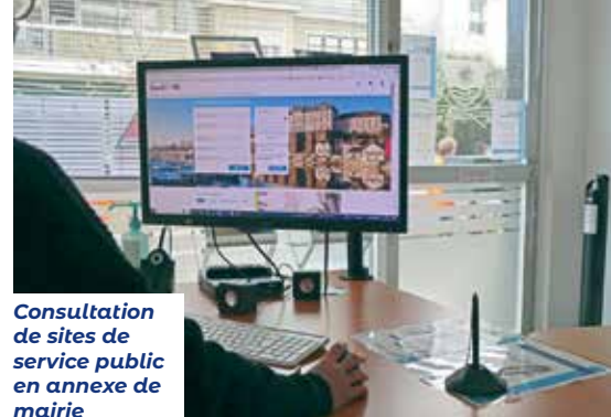
Consultation de sites de service public en annexe de mairie