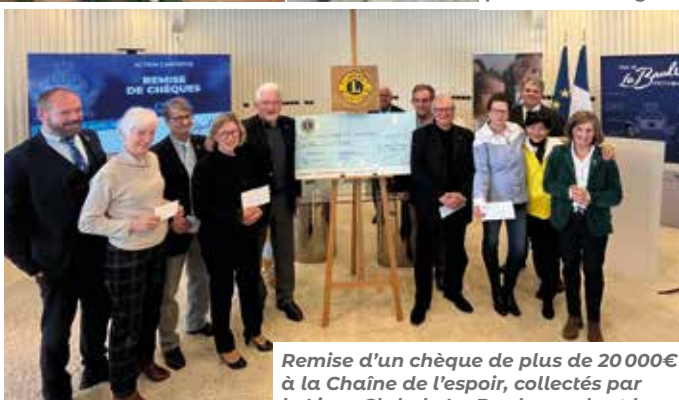
Remise d'un chèque de plus de 20 000€ à la Chaîne de l'espoir, collectés par le Lions Club de La Baule pendant les animations du Noël Magique 2022.