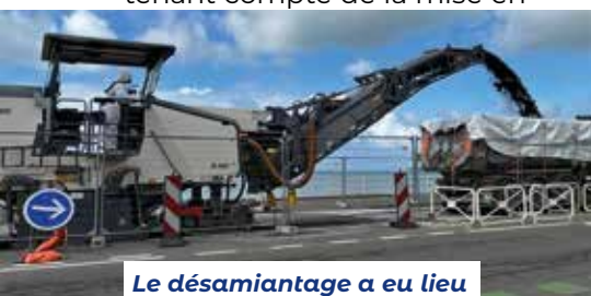
Le désamiantage a eu lieu dans le strict respect des protocoles de sécurité.

Ces travaux ont été effectués rapidement au cours de la seconde quinzaine de mai, en tenant compte de la mise en