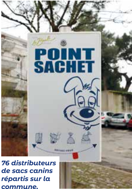
76 distributeurs de sacs canins répartis sur la commune.

Les déjections canines constituent avec les mégots l'une des principales sources de pollution dans la commune, notamment pour la qualité de l'eau en raison de la présence de nombreuses bactéries Escherechia Coli.