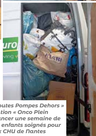
Opération « Toutes Pompes Dehors » avec l'Association « Onco Plein Air » pour financer une semaine de vacances aux enfants soignés pour un cancer aux CHU de Nantes et d'Angers.