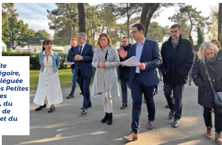
Visite sur site d'Olivia Grégoire, ministre déléguée chargée des Petites et Moyennes Entreprises, du Commerce, de l'Artisanat et du Tourisme.

Des solutions existent donc, encore convient-il d'en saisir l'opportunité. En 2021, CAP Atlantique avait demandé à l'ensemble des 15 communes la création de 220 places d'hébergement pour ces salariés d'ici 2025. La Baule-Escoublac, à elle seule, en a déjà créé plus de 130 en moins de deux ans et la Ville est toujours en recherche de réponses complémentaires. ■