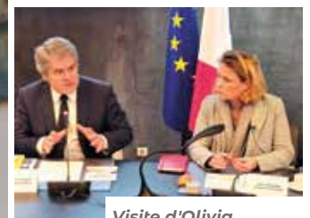
Visite d'Olivia Grégoire, ministre déléguée chargée des Petites et Moyennes Entreprises, du Commerce, de l'Artisanat et du Tourisme