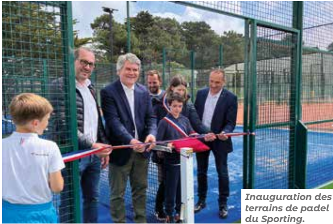
Inauguration des terrains de padel du Sporting.