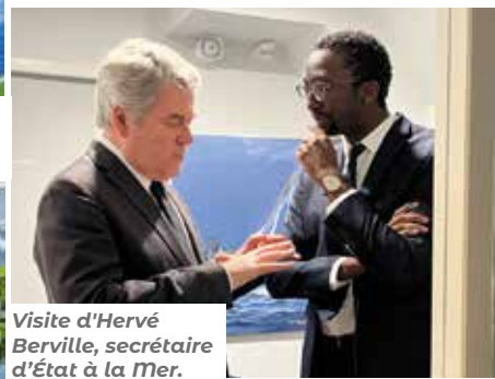
Visite d'Hervé Berville, secrétaire d'État à la Mer.