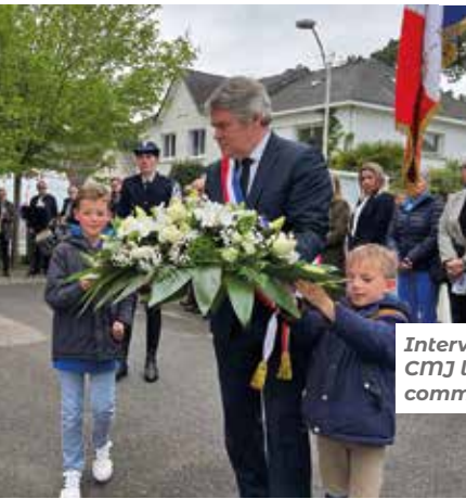
Intervention du CMJ lors des commémorations.