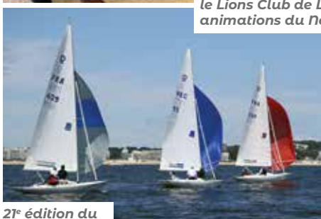
21 e édition du Derby Dragon.