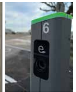
Première borne de rechargement pour véhicules électriques.