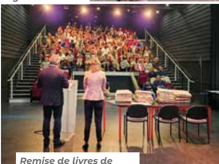
Remise de livres de citoyenneté aux jeunes baulois de CM2