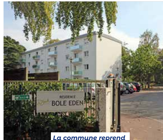
La commune reprend en gestion directe la résidence Bôle Eden

Le contexte économique inflationniste impose aussi une vigilance accrue et un contact régulier avec ceux qui sont isolés et dont les revenus sont modestes. À cet effet, les services du CCAS ont instruit plus de 50 contrats de téléassistance et ont remis lors du dernier semestre près d'un millier de tickets de transport.