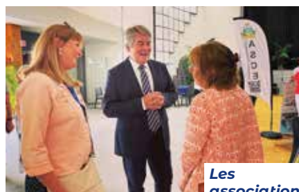
Les associations à l'honneur

Le prochain Forum des associations se tiendra dans deux ans, en alternance avec la sortie du Guide des associations. ■