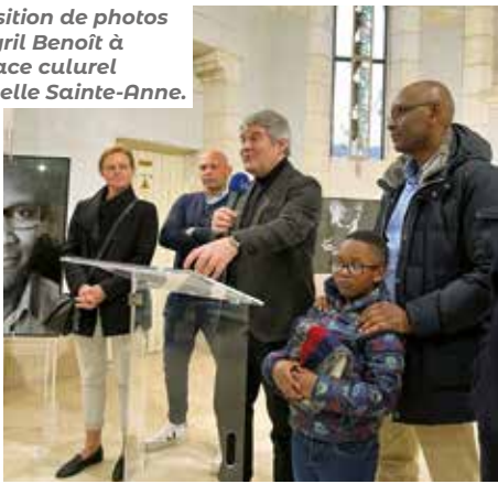
Exposition de photos de Cyril Benoît à l'Espace culturel Chapelle Sainte-Anne.