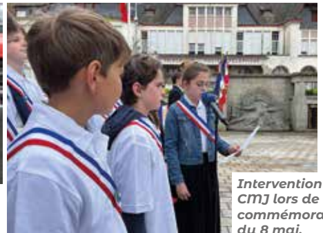
Intervention du CMJ lors de la commémoration du 8 mai.