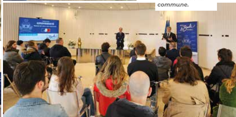
Cérémonie de citoyenneté avec les jeunes de 18 ans nouvellement inscrits sur la liste électorale de la commune.