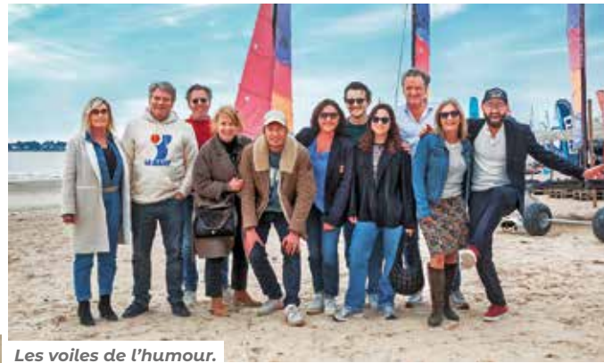
Les voiles de l'humour.