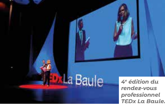
4 e édition du rendez-vous professionnel TEDx La Baule.