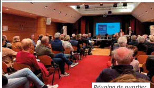
Réunion de quartier sur le projet de promenade de mer.