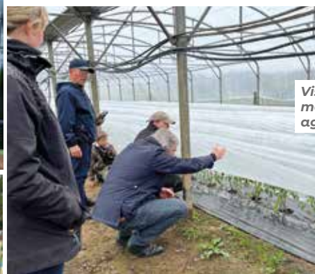
Visites du monde agricole.