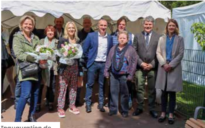
Inauguration de La Baule en fleurs.