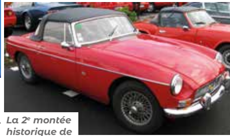
La 2 e montée historique de La Baule.