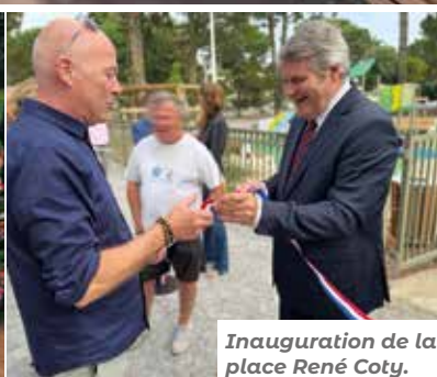
Inauguration de la place René Coty.