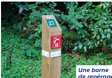
Une borne de repérage

Grâce à une intervention des plus rapides des pompiers de plusieurs casernes de la région, le pire a pu être évité. Il faut dire que préalablement, en collaboration avec les services municipaux concernés, les