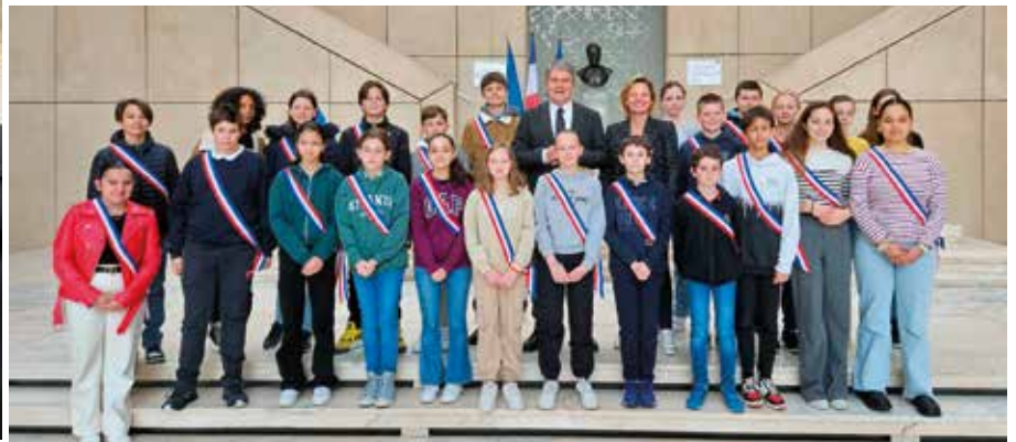
Visite de l'hôtel de Région par les élus du CMJ, Conseil Municipal des Jeunes.