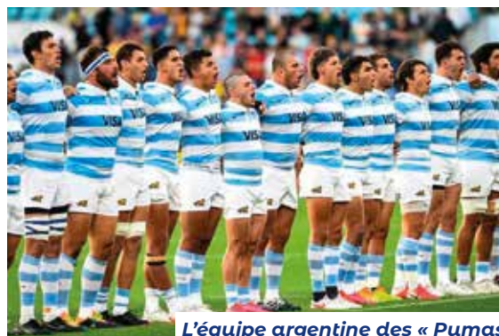
L'équipe argentine des « Pumas »

Ainsi, les actuels champions du monde de padel qui compte plus de deux millions de pratiquants dans le pays, sont deux Argentins. ■