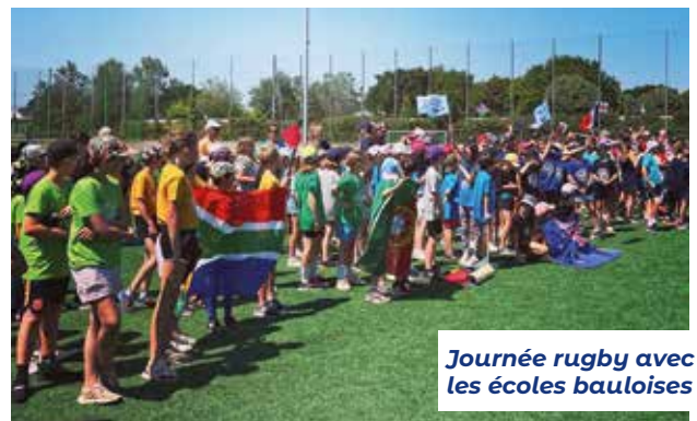
Journée rugby avec les écoles bauloises

Je travaille pour un des plus importants groupes mondiaux de services aux entreprises qui couvre vingt-neuf pays à travers le monde: moi qui voyage encore beaucoup pour raisons professionnelles, mes déplacements me confortent à dire que notre territoire est exceptionnel, d'autant plus avec cette nouvelle dynamique depuis trois ans. ■