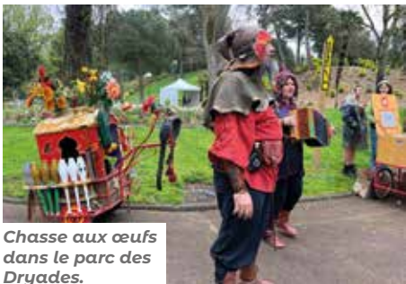
Chasse aux œufs dans le parc des Dryades.