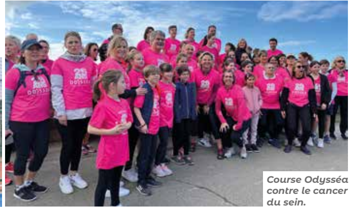
Course Odyssea contre le cancer du sein.