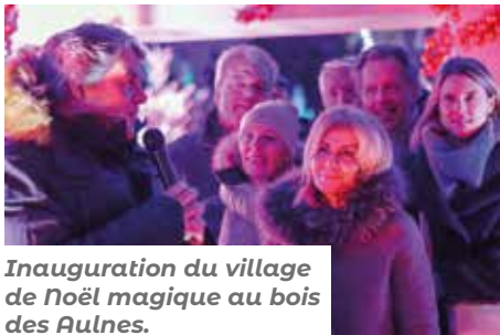
Inauguration du village de Noël magique au bois des Aulnes.