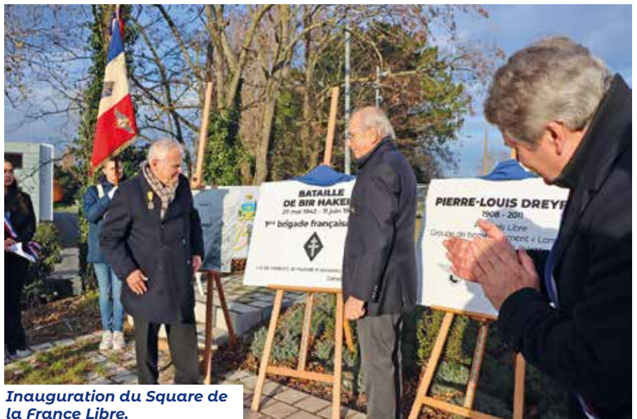
Inauguration du Square de la France Libre.

Pierre Louis-Dreyfus fut également pilote de course avec 11 participations aux 24 heures du Mans entre 1931 et 1955. C'est pour la commune un honneur d'avoir clos l'année « 2022, Année de l'automobile », avec un hommage à cet homme d'exception. ■