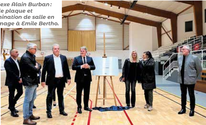
Complexe Alain Burban : pose de plaque et dénomination de salle en l'hommage à Emile Bertho.