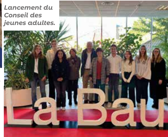
Lancement du Conseil des jeunes adultes.