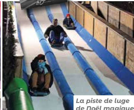
La piste de luge de Noël magique