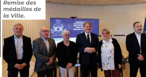
Remise des médailles de la Ville.