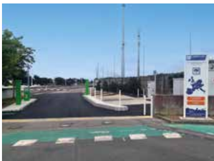
L'aire d'accueil des campings-cars rénovée.