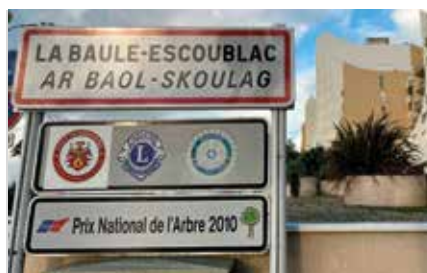
Affirmation de l'identité bretonne de La Baule-Escoublac.