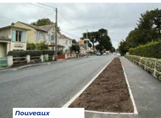
Nouveaux aménagements de l'avenue de Lattre de Tassigny

La largeur de la voie ouverte aux véhicules motorisés est insuffisante pour permettre le croisement, ces derniers empruntent donc la rive lorsqu'ils se font face, en vérifiant auparavant l'absence de cycliste ou, à défaut, en ralentissant.