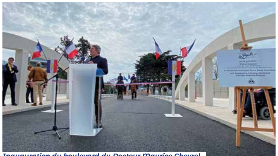
Inauguration du boulevard du Docteur Maurice Chevrel.