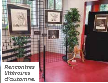
Rencontres littéraires d'automne.