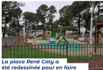
La place René Coty a été redessinée pour en faire un beau lieu de vie paysager (plantations) avec des équipements de loisirs (jeux d'enfants, sanitaires...).