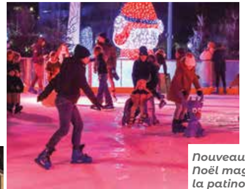
Nouveauté de Noël magique : la patinoire.