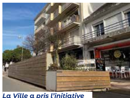
La Ville a pris l'initiative d'installer des terrasses pour les commerces de l'avenue Lajarrige pour l'animer et proposer un espace homogène, esthétique et apaisant.