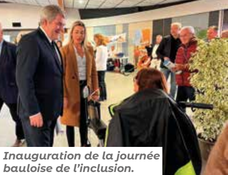
Inauguration de la journée bauloise de l'inclusion.