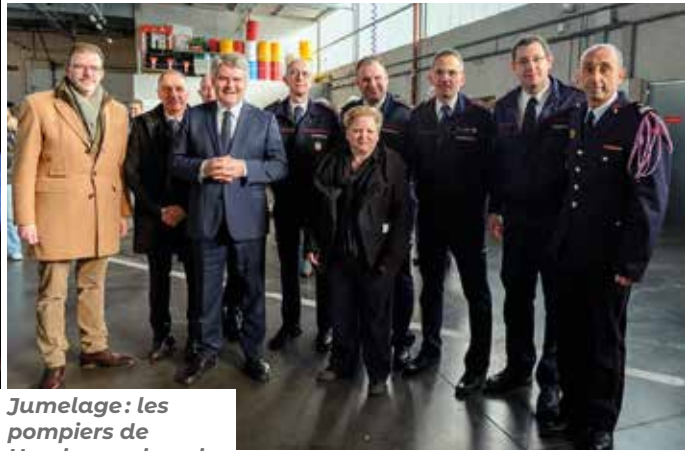
Jumelage : les pompiers de Hombourg, lors de la Sainte-Barbe.