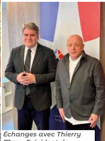
Échanges avec Thierry Marx, Président de l'Union des Métiers et des Industries de l'Hôtellerie.