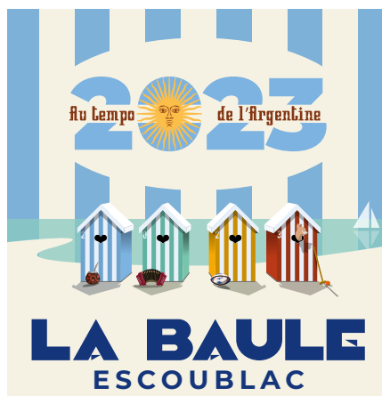
2023, « Année de l'Argentine ».