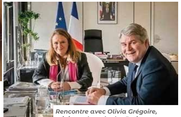
Rencontre avec Olivia Grégoire, ministre chargée des Petites et moyennes entreprises, du Commerce, de l'Artisanat et du Tourisme.