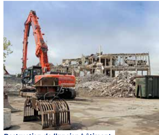
Destruction de l'ancien bâtiment des Pensions de l'Éducation nationale.

L'opération vient d'être lancée, avec comme perspective une sortie de terre fin 2025. ■