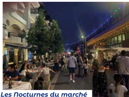
Les Nocturnes du marché ont été créées et se déroulent chaque vendredi soir pendant les deux mois d'été.