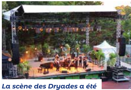
La scène des Dryades a été couverte, et une mise aux normes techniques et de sécurité a été réalisée pour permettre d'élargir l'offre culturelle d'avril à octobre, et pour améliorer le confort des artistes et des spectateurs.