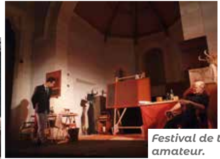
Festival de théâtre amateur.