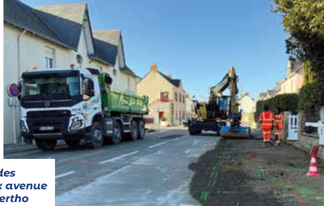
Début des travaux avenue Henri Bertho