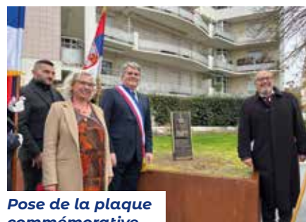
Pose de la plaque commémorative

En prévision, le Conseil municipal de La Baule-Escoublac veut donner à la rue de la gare, lieu d'accueil, un nom pour honorer les Serbes. Rapidement, le choix se porte sur Pierre 1 er de Serbie, « le roi libéral » adoré de son peuple qui le surnommait « l'oncle Pierre ». ■