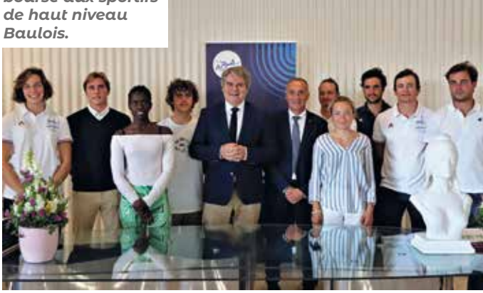
Remise de la bourse aux sportifs de haut niveau Baulois.