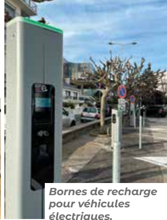
Bornes de recharge pour véhicules électriques.