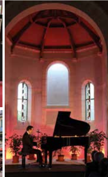
Le week-end en musique