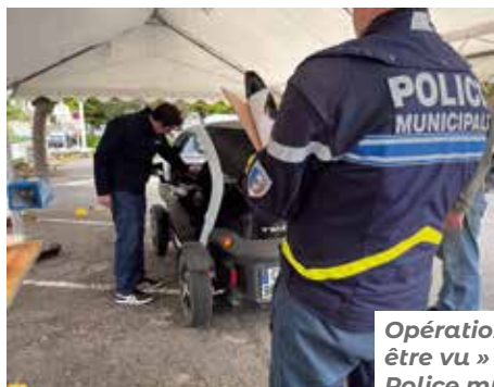
Opération « vu et être vu » avec la Police municipale.