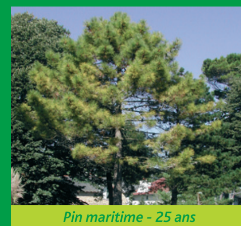
Pin maritime - 25 ans