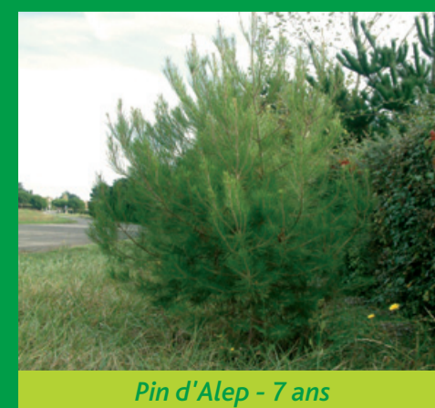
Pin d'Alep - 7 ans

En 2006, la Zone de Protection du Patrimoine Architectural Urbain et Paysager est venue renforcer la réglementation en matière de préservation du couvert arboré.