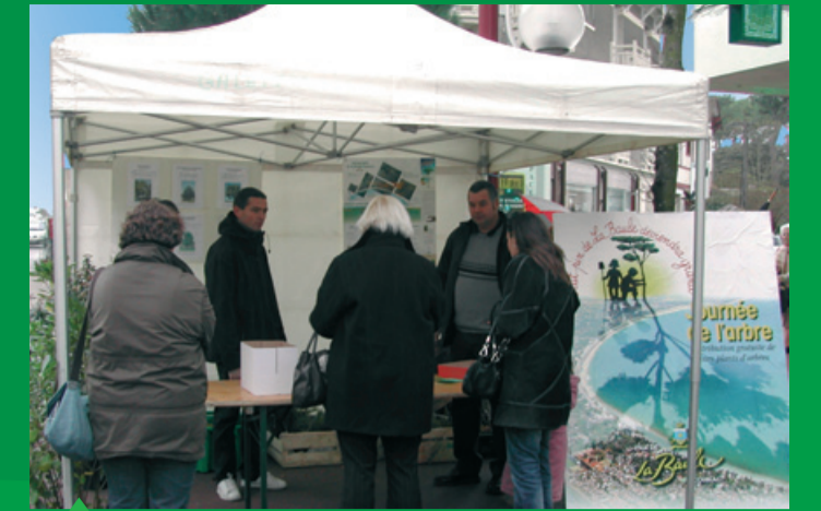
Distribution de jeunes plants aux habitants devant la mairie annexe d'Escoublac, novembre 2008