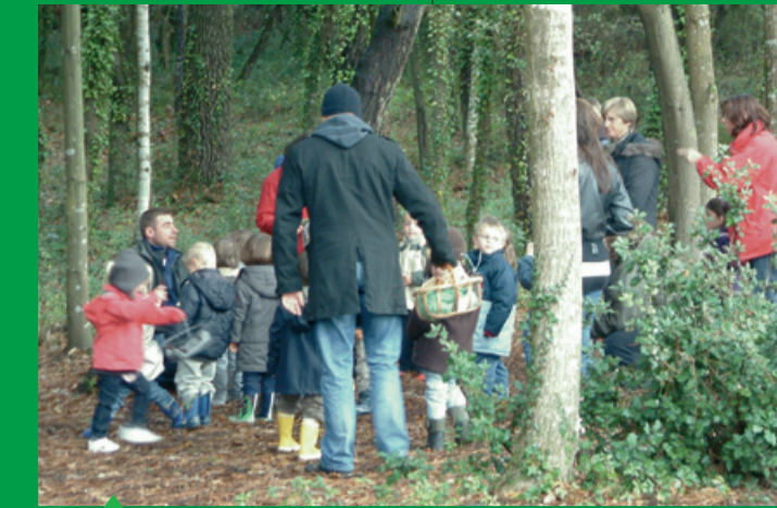
Visite en forêt des élèves avec un agent forestier.