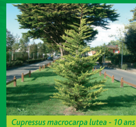
Cupressus macrocarpa lutea - 10 ans