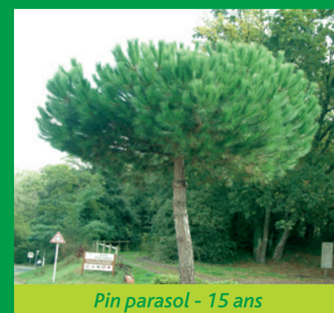
Pin parasol - 15 ans