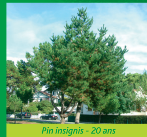
Pin insignis - 20 ans