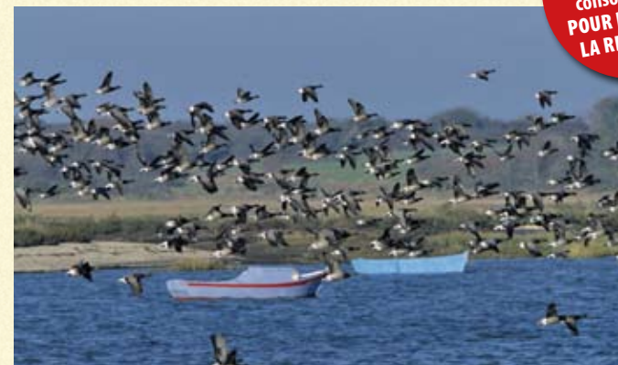
La Bernache cravant est protégée par l'Arrêté Ministériel du 17/04/81