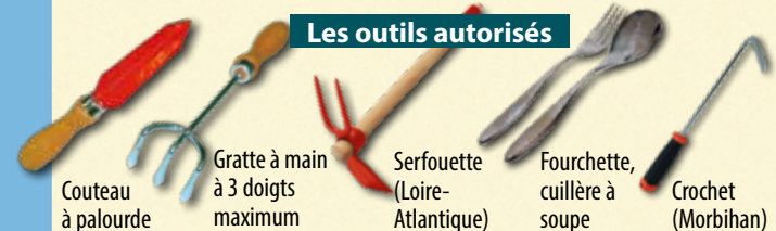
Couteau à palourde • Gratte à main à 3 doigts maximum • Serfouette (Loire-Atlantique) • Fourchette, cuillère à soupe • Crochet (Morbihan)

La taille minimale de capture des coquillages est importante. Elle a été fixée pour permettre la reproduction des animaux: on considère que le coquillage ayant atteint cette taille s'est reproduit au moins une fois.