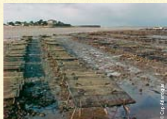
Parc à coques