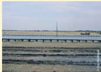
Parc à palourdes ▶

Ces parcs sont identifiés par des rangées de piquets, de tables ou de pieux.