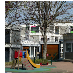
École Paul Minot 3 avenue Paul Minot