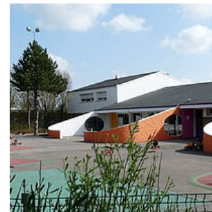
École Bois Robin 3 avenue du Bois Robin